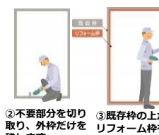
②不要部分を切り取り、外枠だけを残します。