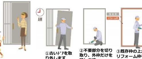
①古いドアを取り外します