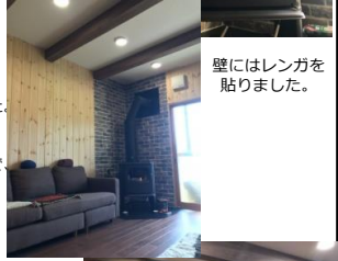
壁にはレンガを 貼りました。

とお話していたのが、 気が付けば 朝晩寒くなってきました。 きっとこのストーブで お孫ちゃんのお待ちかね。 ピザがもうすぐできますよ。 トッピングはもちろん、 ご主人の愛情こめてつくられた 野菜と鳥骨雞の卵ですな！